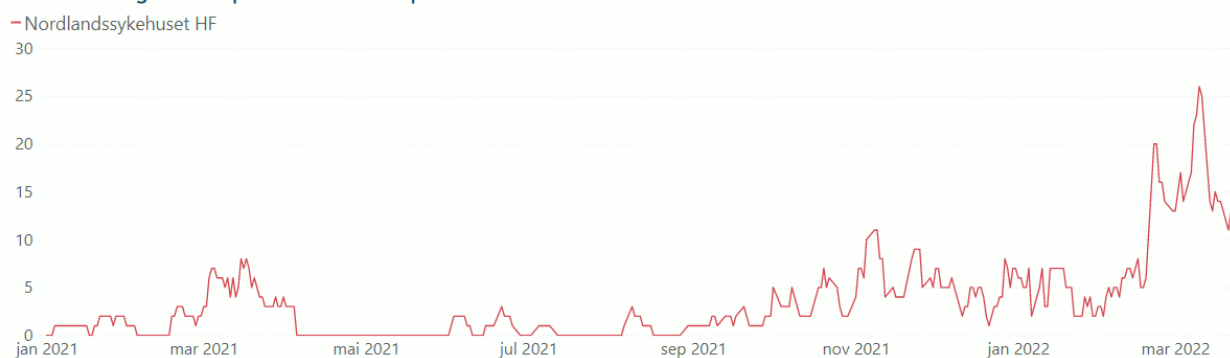
Figur 1: Antall innlagte pasienter med covid-19 i Nordlandssykehuset jan 2021 - mars 2022